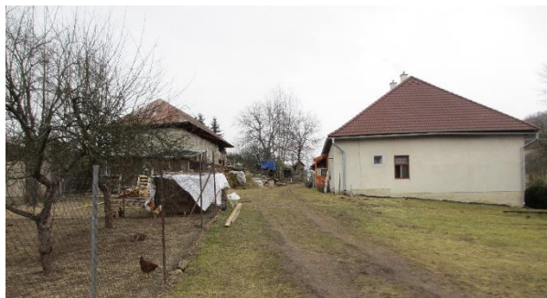
Domov na polceste - Stall und Wohnhaus

Das Projekt ist jung und befindet sich immer noch im Aufbau. Das schrittweise Vorgehen ist nicht nur den beschränkten finanziellen Mitteln geschuldet. Zum Konzept gehört nämlich, dass die Bewohner sich selbst am Aufbau beteiligen, dadurch sichtbare Fortschritte erfahren und Erfolgserlebnisse haben. So ist die Chance gegeben, dass die äusseren Fortschritte sich auch in inneren (Entwicklungs-)Fortschritten niederschlagen.