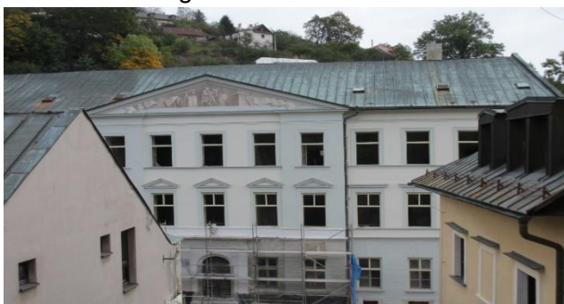
Das Gebäude des ehemaligen Evangelischen Lyzeums wird renoviert

Banská Štiavnica scheint wie aus einem Dornröschenschlaf erwacht zu sein. Und es wird investiert. Das zentral gelegene Hotel Bristol ist nach vielen Jahren tatsächlich wieder ein Hotel, in der Kmeť-Hütte auf dem Sitno bekommt man nach 30 Jahren wieder eine Kohlsuppe, einen Gulasch und etwas zu trinken, kann dort auch übernachten und den Sonnenaufgang genießen, und auch das Buffet am Klingersee ist wieder hergerichtet. Es wird ausgebaut: Blaško's haben ihre «Terrasse» am Počúvadlosee erneut erweitert, und das Salamandra-Resort wartet mit neuen Attraktionen auf. Neue Hotels sind hinzugekommen, und dies keineswegs nur in der Stadt. Banská Štiavnica zieht zunehmend auch zahlungskräftige Touristen an. In Horná Roveň, einem Dörfchen oberhalb von Banská Štiavnica, ging das bemerkenswerte „Altmayer“ in Betrieb, im Nachbardorf Hodruša-Hámre das „Banský dom“ - wie auch das „Altmayer“ in einem historischen Haus. Im Herzen der Altstadt ist das Viersterne-Hotel ERB im Bau. Wenn das zukünftige Hotel tatsächlich der Visualisierung der Projektverantwortlichen entspricht, dann passt es sich gut in die denkmalpflegerisch empfindliche Umgebung ein und ist ein Gewinn für Banská Štiavnica. Überrascht hat mich, dass nun auch das verlotterte Evangelische Lyzeum oben am Dreifaltigkeitsplatz in Renovation ist. Dem Vernehmen nach soll das Haus ebenfalls als Hotel und Kongresszentrum dienen.