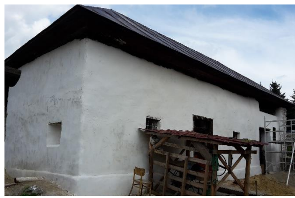
...und acht Monate später

Im Verlauf des Jahres wurde der verlotterte Stall wieder einigermaßen hergestellt, eine verfallene Mauer wiederaufgerichtet, ein Räumchen als Werkstatt so weit hergerichtet, dass es sich darin arbeiten lässt, und das vergandete Weideland vom jahrelang üppig gewucherten Gestrüpp befreit.