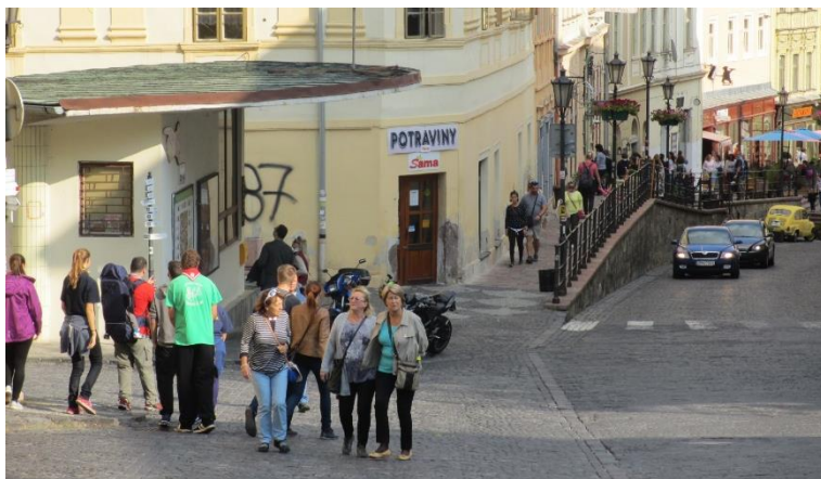
Belebtes Banská Štiavnica

Bei meinem letzten Besuch Anfang Oktober stellte ich in Banská Štiavnica eine bemerkenswerte Entwicklung und eine wachsende Dynamik fest. Zwei Dinge fielen