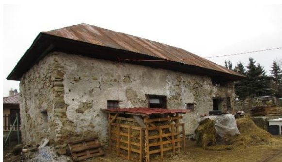
Der Stall im Februar 2016...

Zu tun gibt es auf einem Bauernhof immer etwas. Und auf diesem ganz besonders.